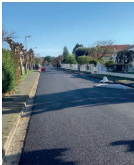
Rue des Rossignols