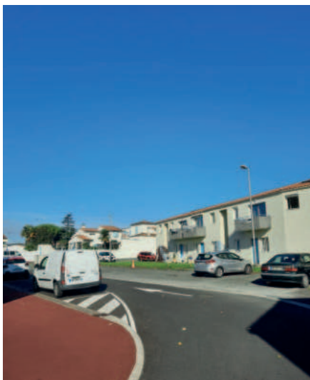
Rue Henri Dupont

Des travaux de revêtements de chaussée en enrobés noirs ont eu lieu du 12 au 15 novembre. Ces travaux ont été présentés aux riverains le 30 septembre dernier. Cette voie restera en double sens et les stationnements seront identifiés et protégés par des ilots formés de bordures et remplis de béton. Les trottoirs en enrobés noirs ne seront pas modifiés.