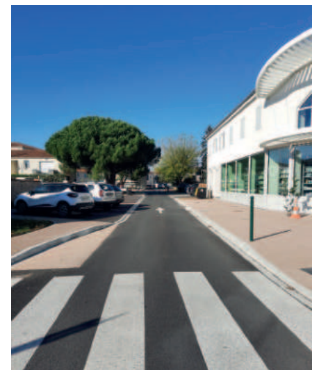
Rue des Vieilles Forges